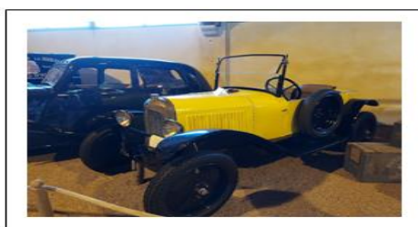
Une des pépites du conservatoire de Donzac : la voiture de Gaston, version sport.

L' A.S.C.P.A Rando a été déclarée à la préfecture de la Gironde le 30 mai 1994 sous le N° W332000777