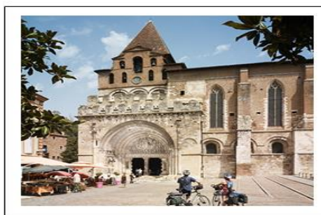
Le portail sud de l'abbatiale Saint Pierre et son très renommé tympan, qui figure le retour du Christ sur Terre à la fin des temps.

8h00 heures Petit déjeuner distribution des paniers pique-niques, chargement des bagages dans le bus. 9h00 Nous quittons le Carmel. Départ à pied vers le centre ville de MOISSAC. 10h00 Visite - ABBAYE MOISSAC. 11h45 nous prendrons le bus qui nous amènera à DONZAC. A l'arrivée ce sera le dernier pique-nique de la sortie. Après ce dernier nous visiterons LE CONSERVATOIRE DES METIERS D'AUTREFOIS. Cette visite se fait en 2 parties durant une heure avec un guide, suivie d'une visite libre environ 1 heure aussi.