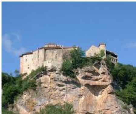
Bruniquel : le château vieux et le château jeune, datant des 12 ème et 15 ème siècles. A voir, parmi les expositions permanentes : la salle consacrée au site préhistorique de la grotte de Bruniquel.

Petit déjeuner à 7h30 distribution des pique-niques par l'hébergeur 8h15 Nous montons dans le bus direction BRUNIQUEL distant d'environ 60km